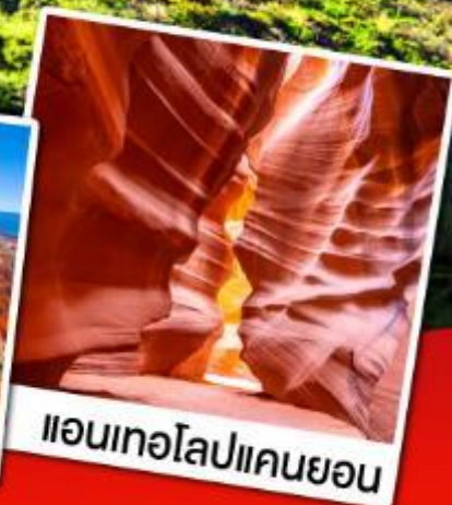
แอนเทอโลปแคนยอน