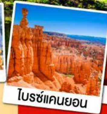
โบรซ์แคนยอน